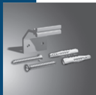
Mit EASYQuick und Einfach-Wandhalter