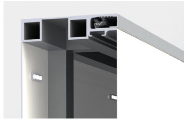
Aufsatzprofil JP (Bautiefe 67 mm)