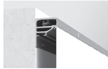
Aufsatzprofil Wandmontage (Bautiefe 50 mm)

EPS.LUMI GRIP eignet sich gerade für Anwendungen in schwer zugänglichen Bereichen oder bei besonderen Anwendungen wie z.B. Nischen oder auch für Lichtdecken.