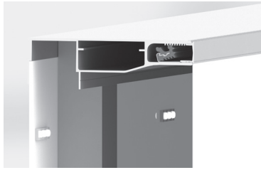
Grundprofil (Bautiefe 150 mm)